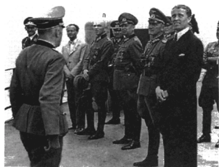
Deutsches Museum Munich