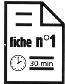
Garchette Communication, Saint-Omer